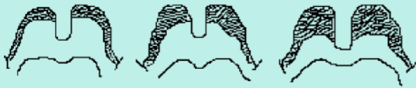
Abb.4 ▲ Webbing. Von links nach rechts: normal ( \leq 5 mm), mäßig (5–10 mm), ausgeprägt (> 10 mm)