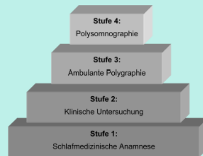
Abb.2 ▲ Stufenschema